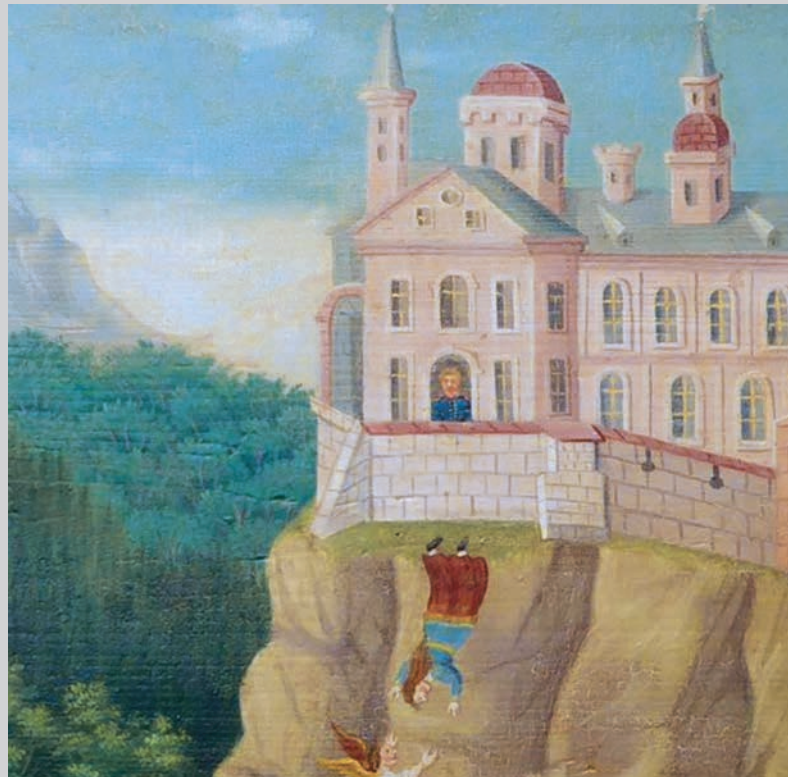
Idda von Toggenburg – Ausschnitt aus einem Gemälde im Toggenburger Museum Lichtensteig

Nur knapp entkam eine 35-jährige Frau dem Tod: Im Jähzorn stiess ihr eifersüchtiger Ehemann sie aus dem Fenster der heimischen Burg in die Tiefe.