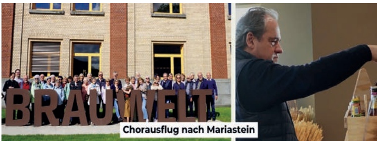
Chorausflug nach Mariastein

Aktivitäten des Katholischen Kirchenchor Balgach, nebst der Mitwirkung in den Gottesdiensten: