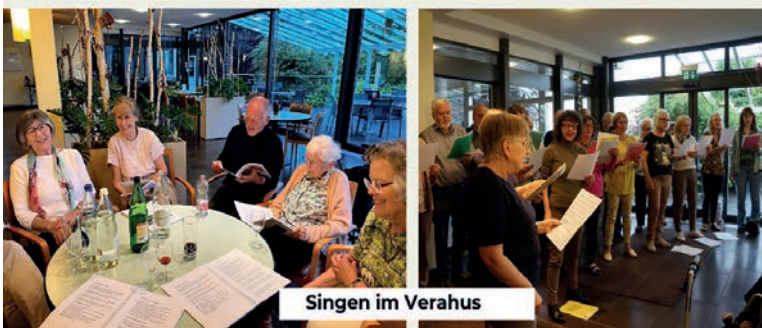
Singen im Verahus