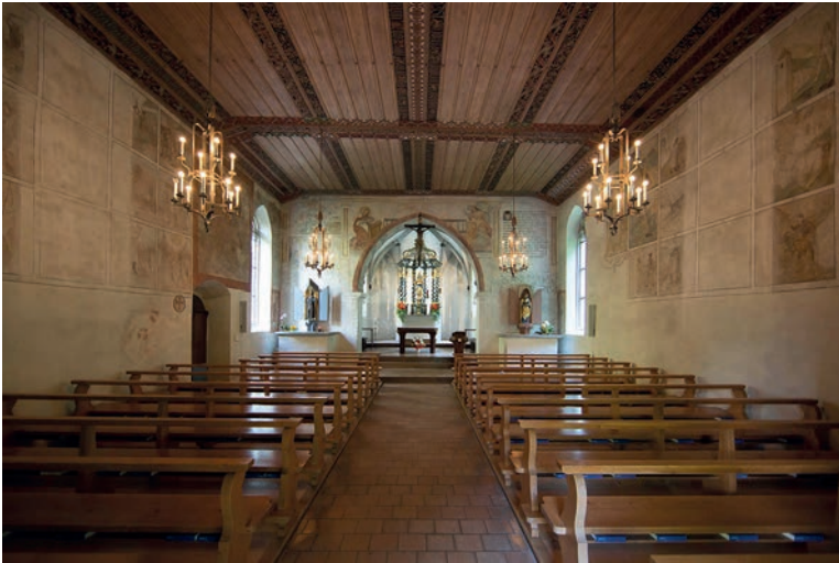
Untere Ranftkapelle – diese grössere Ranftkapelle wurde 1501 erbaut und 1504 zu Ehren der Mutter Gottes, Maria Magdalena des heiligen Kreuzes und der 10'000 Ritter geweiht.