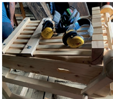
Bild: Mit der neuen Klapper konnte in der Glockenstube der Josefskirche ein drittes Gerät in Betrieb genommen werden.

Erstmals ertönten die Klappern dreistimmig. Elmar Hutter hat in ehrenamtlicher Schreinerarbeit ein drittes Gerät gezimmert, das erfolgreich in Betrieb genommen werden konnte.