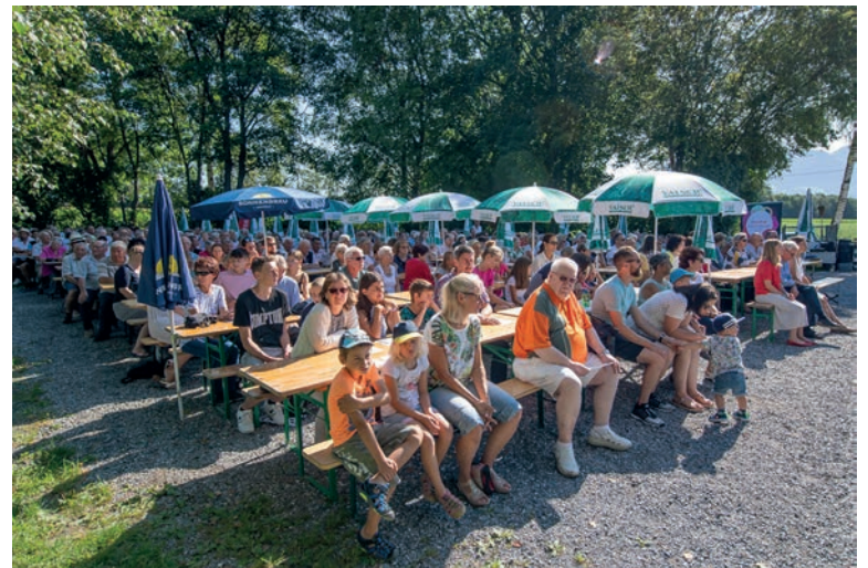
Zahlreiche Teilnehmer am Drei-Brückengottesdienst 2019. Beginn der Feier ist um 10.00 Uhr, begleitet vom Musikverein Diepoldsau-Schmitter. Mitgebrachte Kräuter werden gesegnet. Anschliessend verkaufen Jungwacht und Blauring zu günstigen Preisen Grilladen und Getränke. Für Kinder gibt es einen Spielparcours. (Haftung der Eltern).

Herzlich laden das Seelsorgeteam und die Pfarreiräte Widnau, Balgach, Diepoldsau/Schmitter zum Besuch des Drei-Brückengottesdienstes mit Fest ein.