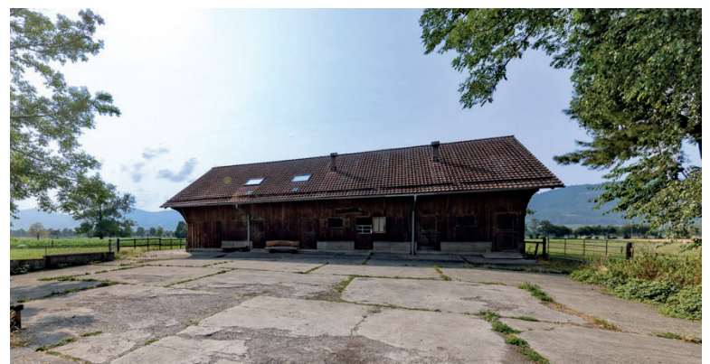
Trattohof der Ortsgemeinde Balgach. Bei schlechter Witterung findet der Gottesdienst in der katholischen Kirche Widnau um 10.00 Uhr statt.

Da nur sehr wenige Autoparkplätze zur Verfügung stehen, wird empfohlen, mit dem Velo zu kommen. Es besteht die Möglichkeit eines Fahrdienstes. Bitte melden Sie sich beim Pfarramt Ihres Sekretariates bis spätestens 10. August an.