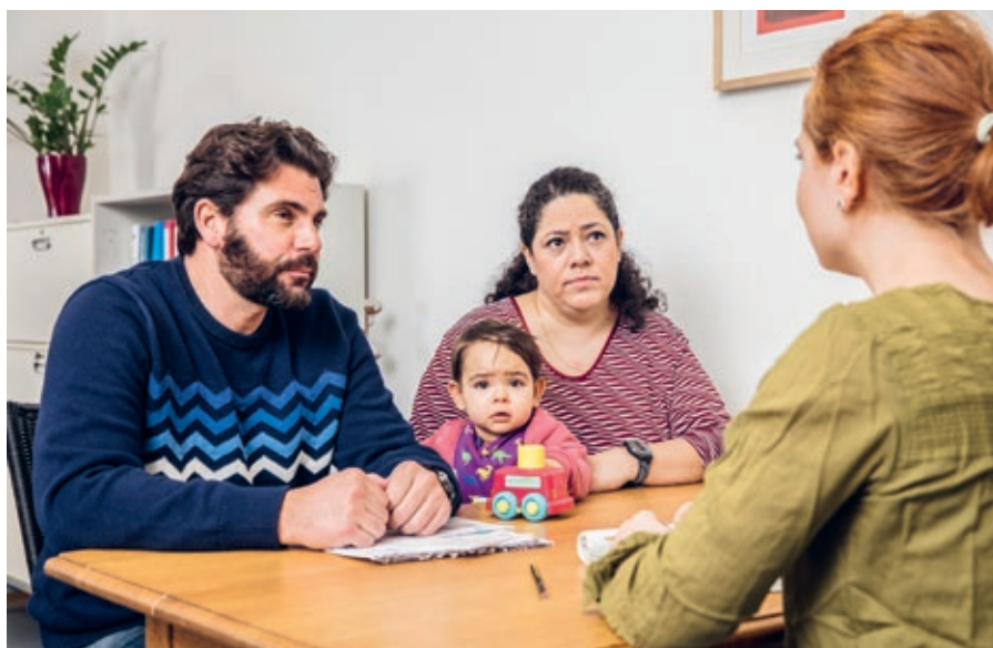
↑ Bei Caritas finden Armutsbetroffene eine professionelle Schuldenberatung. Diese hilft zu verhindern, in die Schuldenspirale zu geraten.

Die wirtschaftlichen Verwerfungen der Pandemie wirken noch immer nach: Diverse kulturelle und gemeinnützige Angebote, aber auch Privatpersonen sind deswegen auf finanzielle Unterstützung angewiesen. Auch die katholische Kirche erhält zunehmend mehr Anfragen.