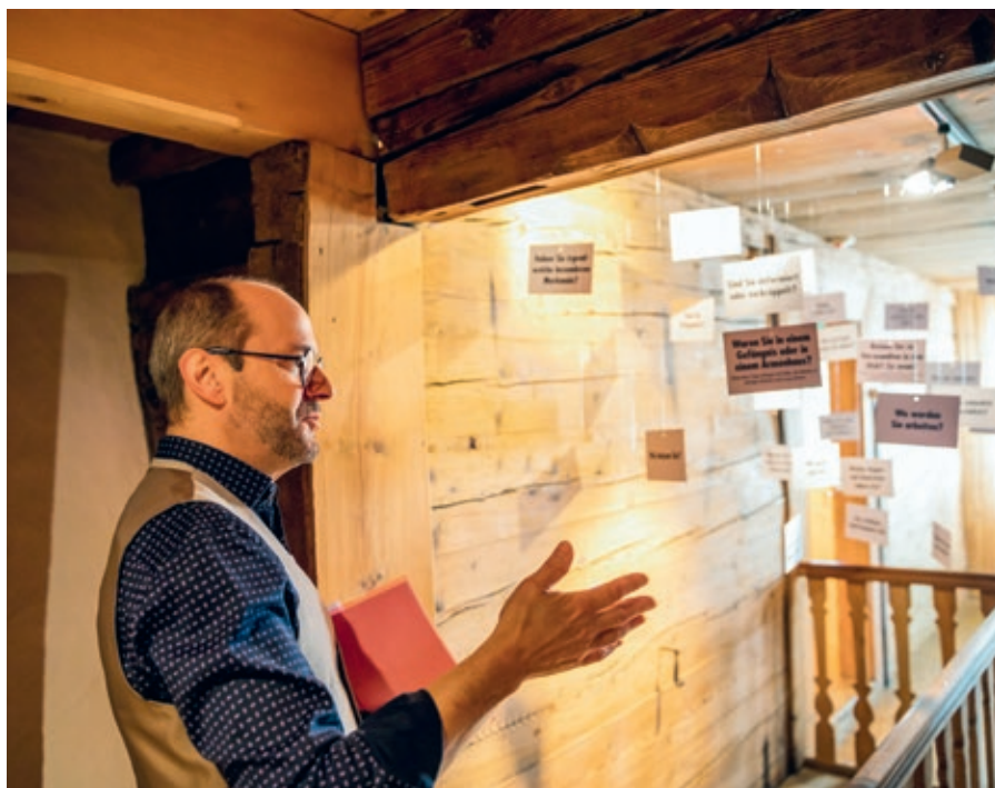
↑ In den Ausstellungsräumen des Reisebüros Linth dreht sich alles um die Suche nach Glück, Heimatgefühle, Flucht, Abenteuer, Fernweh und fremde Kulturen.

Warum migrieren Menschen? Das «Reisebüro Linth» nimmt die Besuchenden mit auf eine emotionale Reise. Die Ausstellung regt mit überraschenden Interaktionen und Inszenierungen an, die Perspektive von Migrantinnen und Migranten einzunehmen.