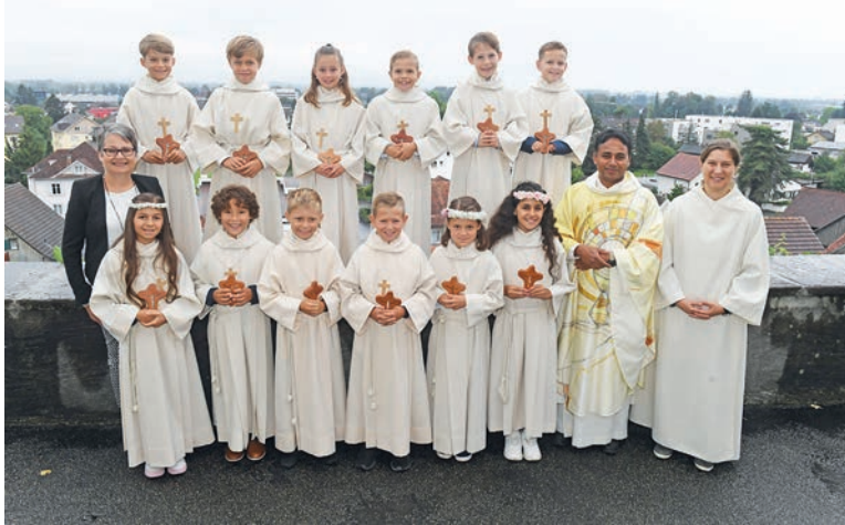
Erstkommunion – 1. Gruppe