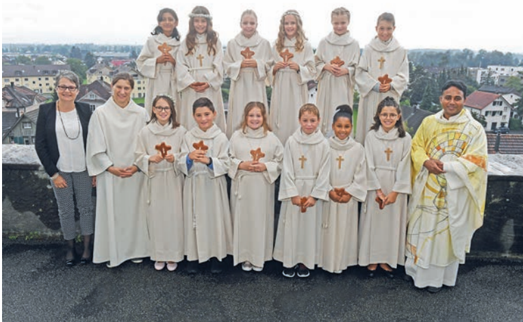
Erstkommunion – 2. Gruppe