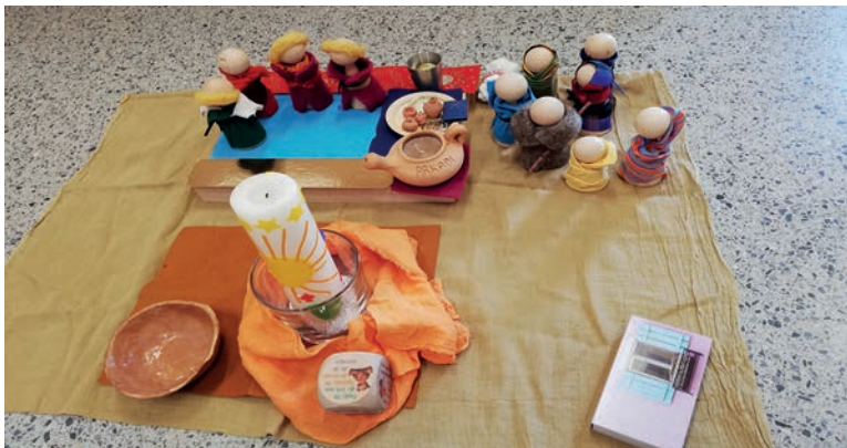
Alexandra Moser, Religionspädagogin

stehen» und «Gott und die Welt» angeboten. Weitere Informationen: www.religionspaedagogik-sg.ch/fakaru/ausbildung