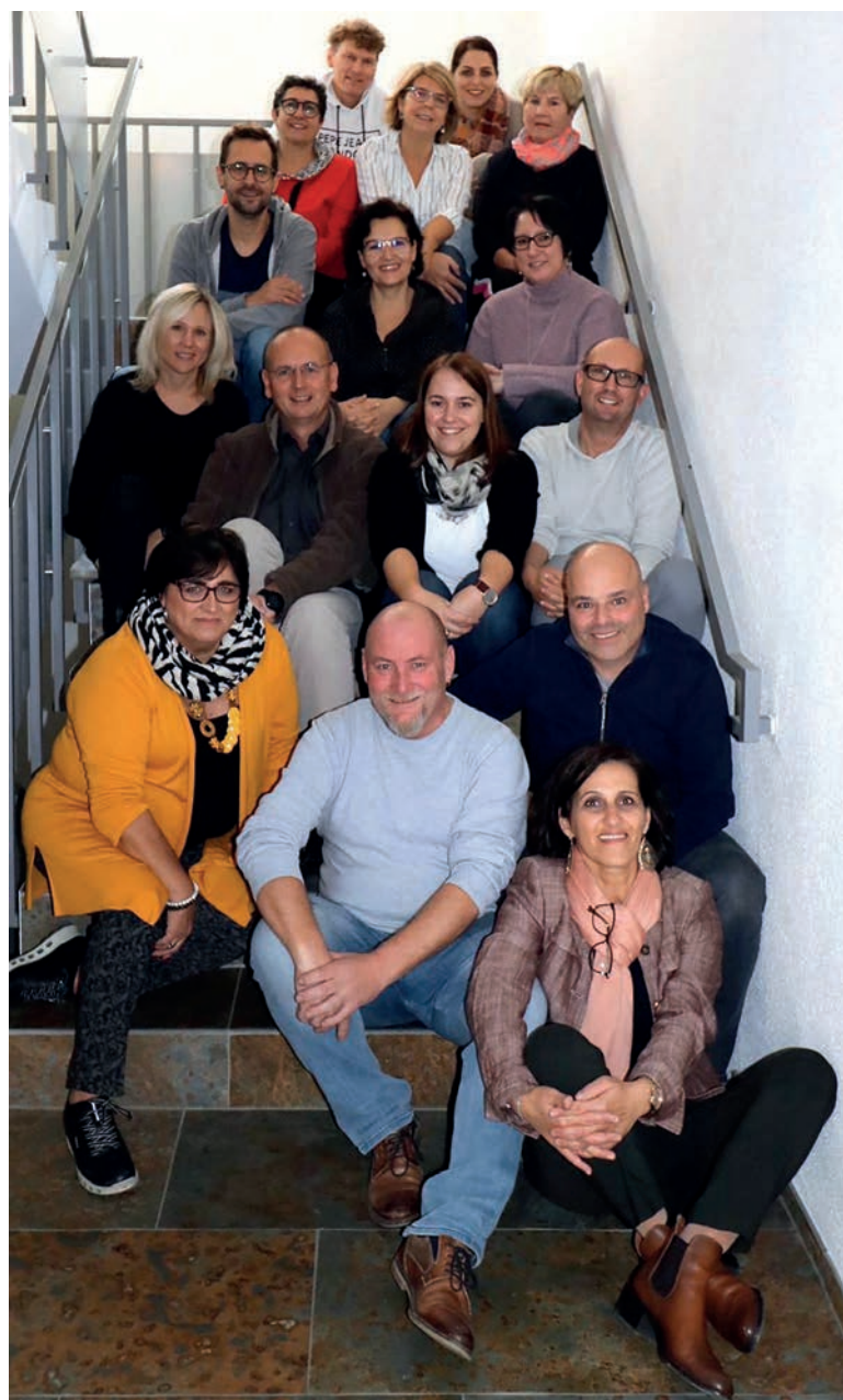
Unser Pfarreirat (alte und neue Mitglieder) bei der Jahresplanung im November