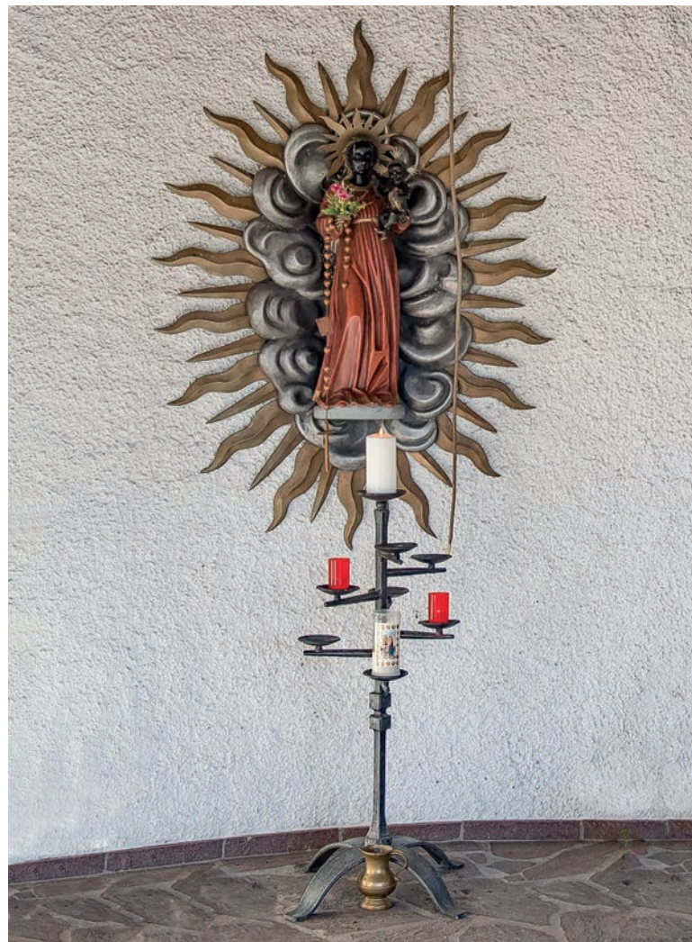
Die schwarze Madonna in der Einsiedlerkapelle, Foto: Fredy Roth

Sonntag, 08. Dezember: Andacht zu Maria Empfängnis