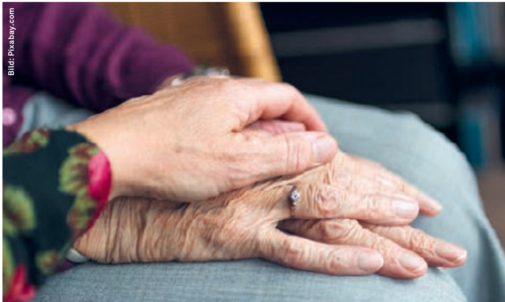
Die ökumenische Hospizgruppe Flawil unterstützt Angehörige und Pflegende.

«Bei der Sterbebegleitung geht es uns um gelebte Nächstenliebe. Diese ist nicht an eine