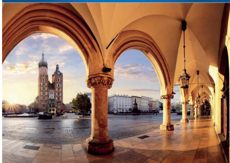
Krakauer Marktplatz mit Blick auf die Marienkirche