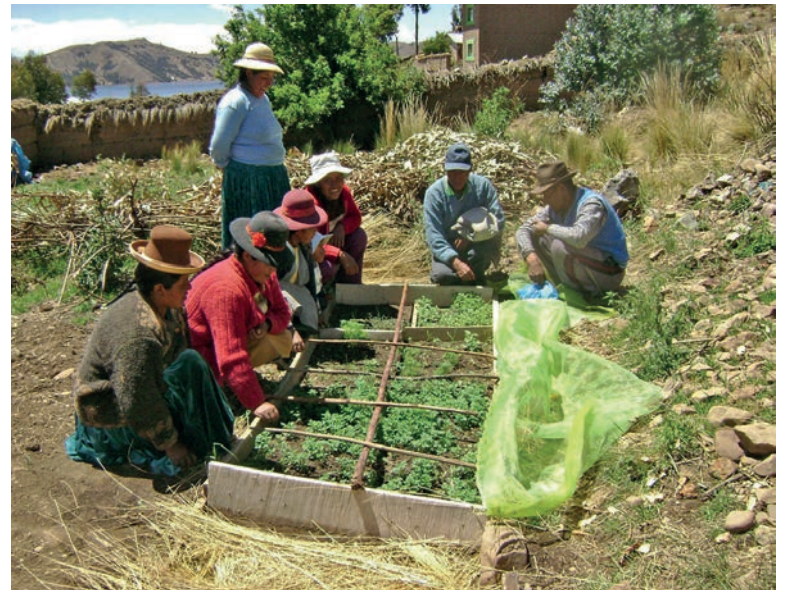
Heilkräuter-Anbau in Peru