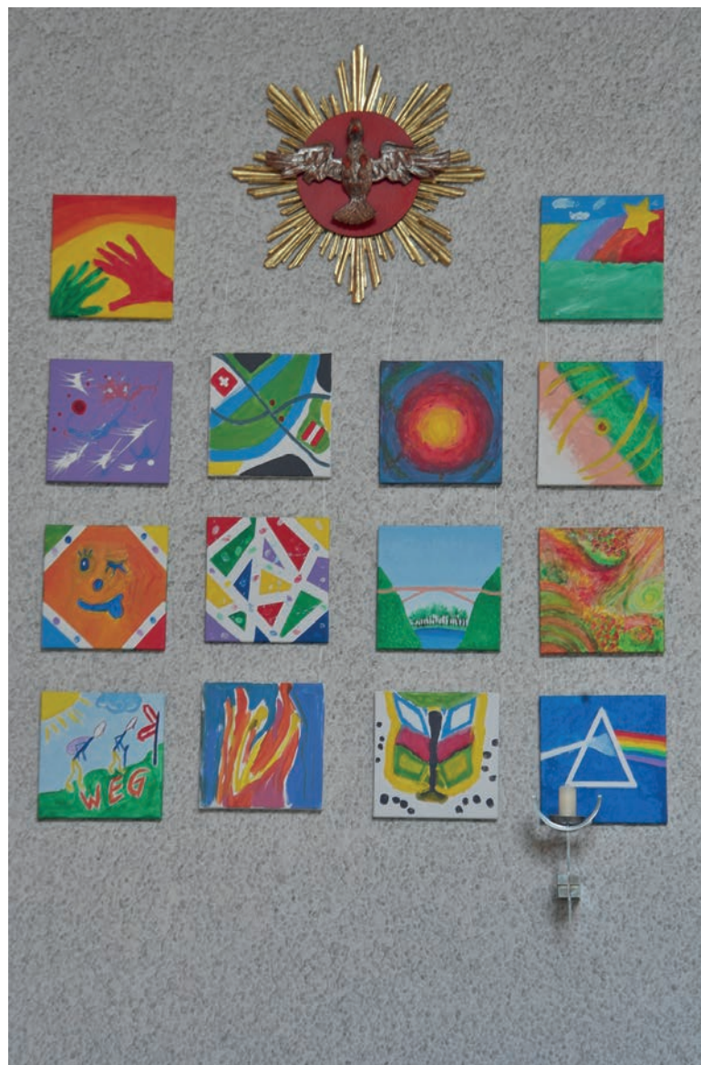
(Bild: von unseren Firmlingen und den Paten gestaltete Bilder, die in unserer Kirche hängen)

Bitte beachtet, dass der 18.30-Uhr-Gottesdienst daher entfallen wird.