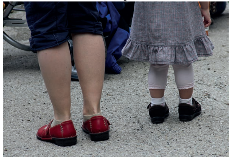
Am Donnerstag, 21. September 2017, um 09.30 Uhr findet in der evangelischen Kapelle Widnau ein weiterer Krabbelgottesdienst nach der Sommerpause statt.

Für unsere Kleinsten (vom Geburtsalter bis zum Eintritt in den Kindergarten) und die erwachsenen Begleiter finden die ökumenische Feiern im Monatsrhythmus statt.