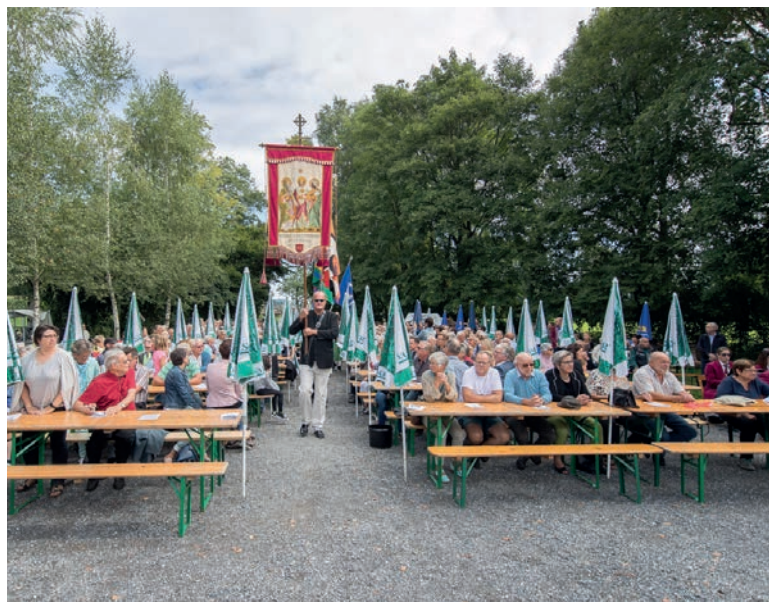
Fahneneinzug zu Beginn des Gottesdienstes

Nach einigen Regentagen begrüßte ein schöner Sommermorgen die Besucher des Gottesdienstes bei den 3-Brücken.