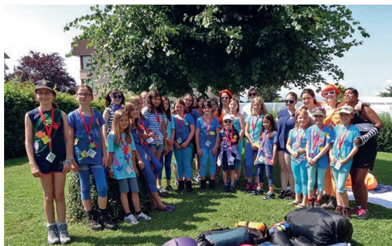
Das Leiterinnenteam, Blauring Balgach