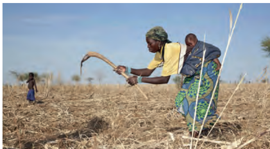
Bäuerin in Burkina Faso

Glücklich alle, die auf das meiste verzichten können, weil sie es gar nicht brauchen. Sie sind am reichsten.