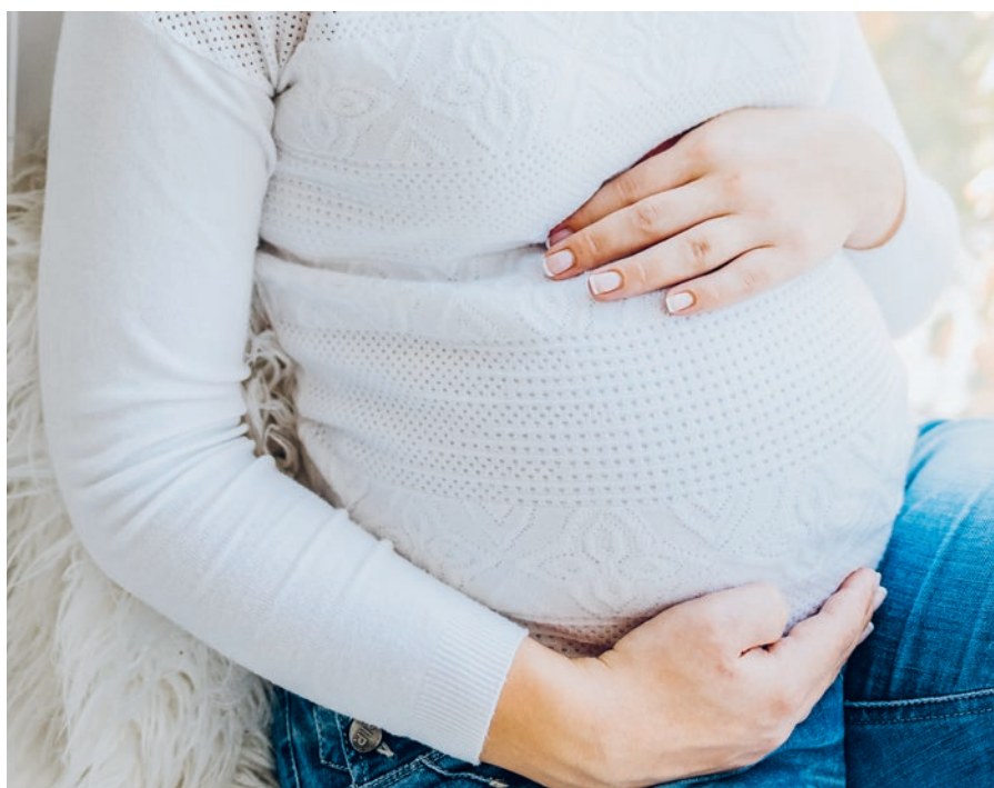
↑ Häufig führen finanzielle Probleme, mangelnde Unterstützung durch den Kindsvater oder das jugendliche Alter werdende Mütter in eine Notsituation.

Vertrauliche Geburten werden am KSSG in enger Zusammenarbeit der Frauenklinik und der spitaleigenen Sozial- und Austrittsberatung betreut. Ziel ist es, dass betroffene Frauen unter medizinischer Betreuung im Spital gebären und dabei auf höchstmögliche Diskretion zählen können. «Die schwangere Frau bekommt bei uns bei Bedarf einen Decknamen. Zudem achten wir darauf, dass ihre Anwesenheit im Spital gegenüber Dritten nicht bekannt gegeben wird und keine Unterlagen nach Hause geschickt werden.» Gegenüber dem Zivilstandsamt werden die Geburt und die Personalie der Mutter allerdings deklariert, das sieht die gesetzliche Meldepflicht so vor. «Die Geburt ist also vertraulich, aber nicht vollständig anonym», sagt der KSSG-Mediensprecher. Zu den Gründen, weshalb Frauen geheim gebären möchten, kann er nicht viel sagen. «Meist sind es schwierige familiäre Umstände, die die Frauen veranlassen, über eine vertrauliche Geburt nachzudenken und gegebenenfalls auch umzusetzen.»