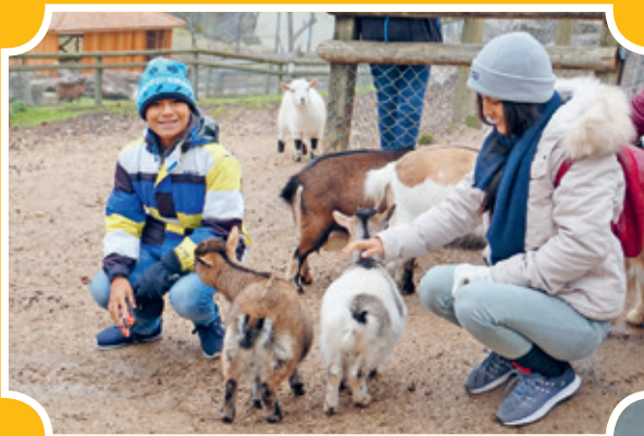
Die Gruppe aus Peru besuchte auch die Pfarrei Oberriet und den Walter Zoo in Gossau.

Die Stadt Iquitos (440 000 Einwohner) liegt mitten im Dschungel des peruanischen Amazonasgebiets, man kann sie nur per Flugzeug und Schiff erreichen. Das Klima ist heiss und feucht. Überschwemmungen sind häufig. Auf der Suche nach Arbeit verlassen viele Personen ihre Dörfer, gelangen nach Iquitos oder in andere Regionen Perus.