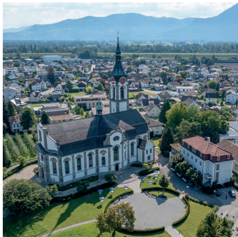
Drohnenaufnahme vom Patrozinium 2022