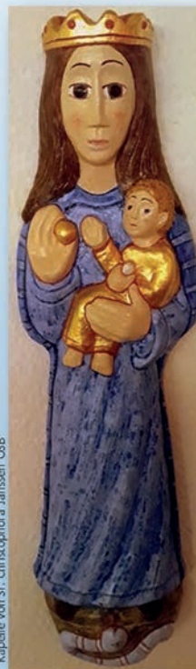
Bild: Marienbild in der Jüdis-Thaddäus-Kapelle von Sr. Christophora Janssen OSB